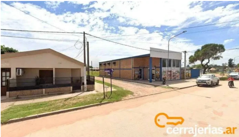
Maderistica charata charata