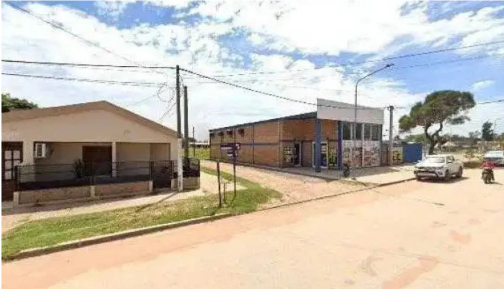
Maderistica charata como llegar